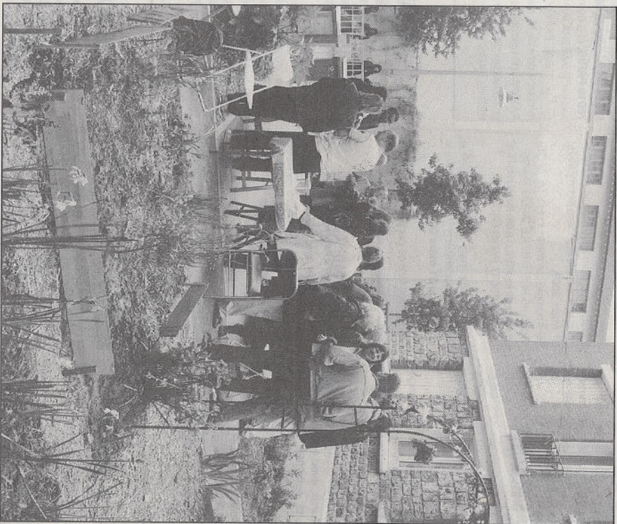
156, RUE RAYMOND-LOSSERAND (XIV e ), SAMEDI. Ce jardin a été inauguré en présence du baillieur, Paris Habitat, de dizaines de locataires et de Pascal Cherki, le maire (PS) du XIV e .